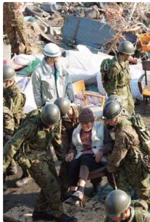
被災者を救援する自衛隊員。

自らの危険を顧みず、被災者の救援、復旧・復興に全力を傾けている自衛隊・警察・消防・海上保安庁の活動に感謝し、活動を全面的に支援します。国家の危機管理体制を立て直し、国民の生命・財産を守ります。