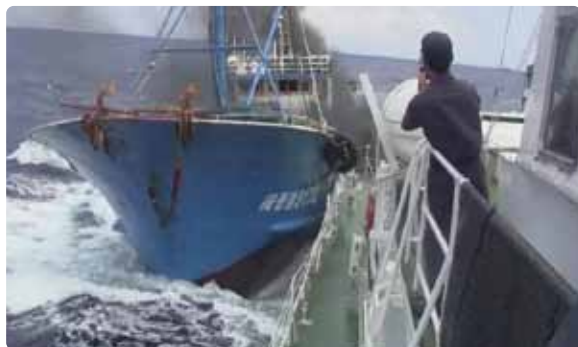
記憶に新しい中国漁船衝突事件。