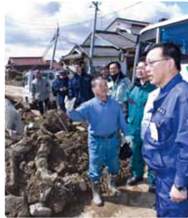
被災地で現場の声を聞く谷垣総裁