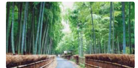
地方には、観光立国への魅力があふれている。