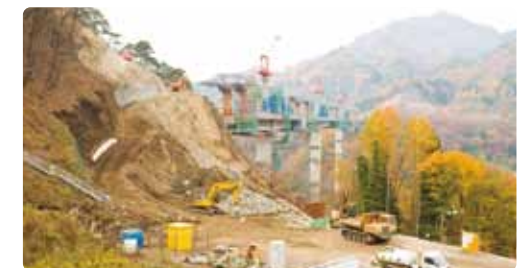
「コンクリートから人へ」では暮らしは守れない。写真は、突然事業が中断されたハツ場ダム。